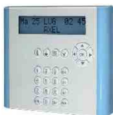
Gamma colori disponibili